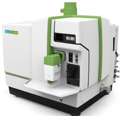
NexION 2000 ICP-MS

本文介绍了利用快速消解法与 PerkinElmer 最新 ICP-MS NexION® 2000 对土壤样品中重金属污染物检测的实例。