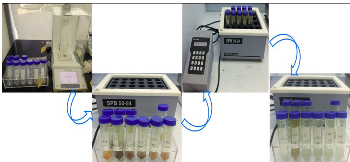
图 1. 土壤快速消解流程: 1、样品称量; 2、加入消解试剂并摇匀; 3、放入 SPB 石墨消解仪中加热回流; 4、冷却定容